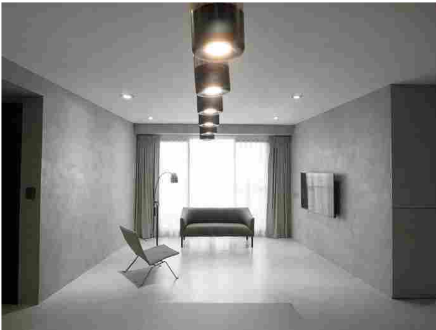
LHS, Life House, Novacolor

Stile essenziale e sfumature di grigio sono i due elementi chiave del progetto residenziale realizzato da Timeroots Design a Taiwan, nel distretto di Xitun a Taichung .