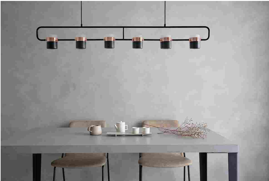
LHS, Life House, Novacolor

Autore del progetto dell'accogliente abitazione è il giovane designer taiwanese Lee Ming-Kang , che si è ispirato ad un'idea di spazio che predilige il vuoto "animato" solo da pochi pezzi d'arredo dal design altrettanto minimal. Ma che vengono esaltati dalla qualità e dalle tonalità delle speciali finiture Novacolor : sono ARCHI+ CONCRETE e WALL2FLOOR, due tra le più apprezzate finiture dell'Azienda, impiegate sia per le superfici verticali sia per le pavimentazioni dell'appartamento.