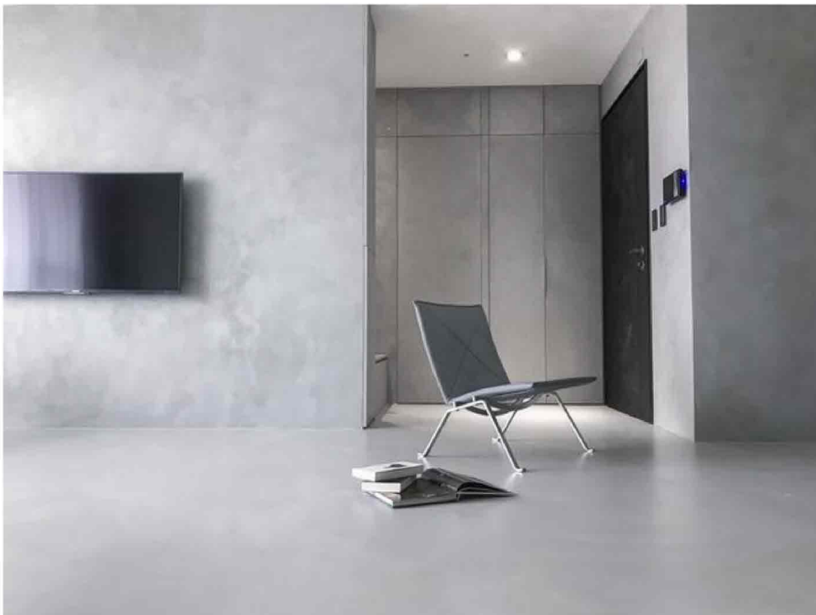
Novacolor | Rivestimento senza giunti Wall2floor.

Archi+Concrete è un intonachino di calce in polvere per interni, composto da calce idrata, cemento bianco, inerti accuratamente selezionati e modificanti reologici . La particolare curva granulometrica del prodotto e la sovrapposizione di uno o più strati di velatura acril-silossanica Antiche Patine, consentono di ottenere effetti simili al cemento e per questo motivo impiegabili nelle più attuali e moderne opere di design d'interni.