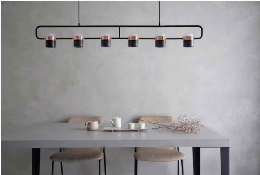
Novacolor | Intonachino Archi+Concrete dall'effetto cemento.